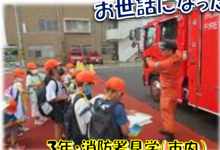
3年・消防署見学(市内)