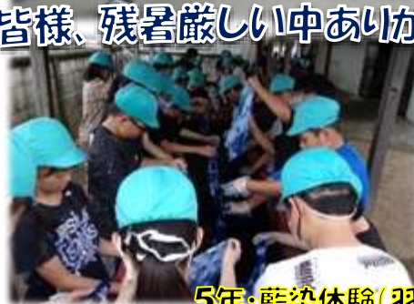
5年・藍染体験(羽生市)・自動車工場(太田市)