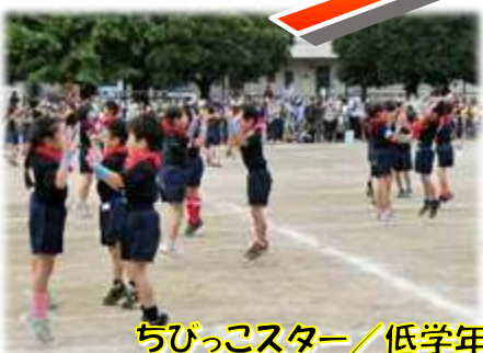
ちびっこスター/低学年