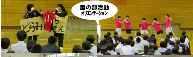
嵐の部活動 オリエンテーション