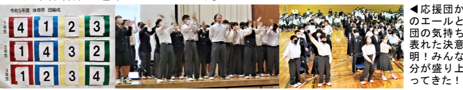
▲応援団からのエールと各団の気持ちが表れた決意表明! みんな気分が盛り上がりすぎてきた!

体育祭の運命を左右する色団が決まった! 体育祭の大きな魅力のひとつ、それは何と言っても『縦割り』だ。■3年生が学校の「顔」として、1・2年生を引っ張る! ■2年生が学校の中心として、3年生をあおり、1年生を支える! ■1年生は歯を食い縛り、必死で先輩を追いかけ…その過程が1年生を中学生にしてくれる! ■全校生徒411名と教職員44名がひとつになる…これが『縦割り』の醍醐味に他ならない。西中全体でのTeamwork(チームワーク)! これが発揮できるかできないかに西中体育祭の運命がかかっている。