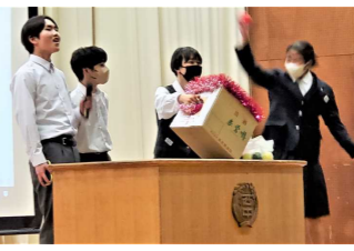
▲色団決め抽選会の様子。思ったとおり色を引き当て、喜ぶ代表生徒。さて一体どんな体育祭になるのか?

体育祭の運命を左右する色団が決まった! 体育祭の大きな魅力のひとつ、それは何と言っても『縦割り』だ。■3年生が学校の「顔」として、1・2年生を引っ張る! ■2年生が学校の中心として、3年生をあおり、1年生を支える! ■1年生は歯を食い縛り、必死で先輩を追いかけ…その過程が1年生を中学生にしてくれる! ■全校生徒411名と教職員44名がひとつになる…これが『縦割り』の醍醐味に他ならない。西中全体でのTeamwork(チームワーク)! これが発揮できるかできないかに西中体育祭の運命がかかっている。