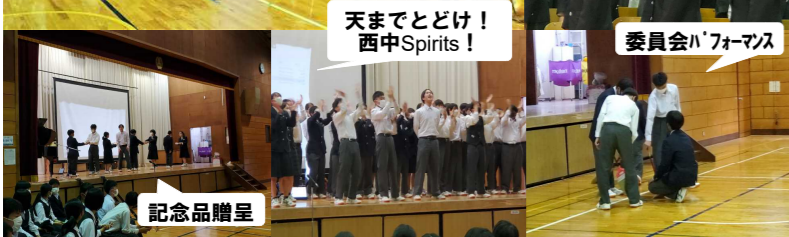
天までとどけ! 西中Spirits!