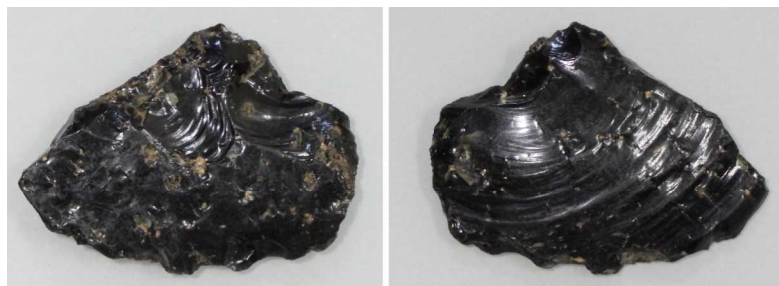
図 2 採集石器写真