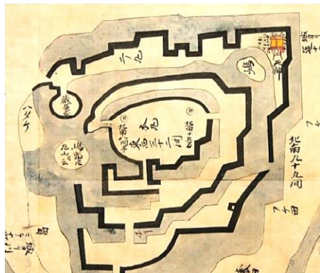
難波田城図(部分)