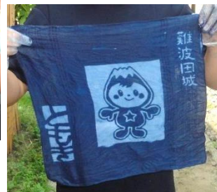
オリジナルハンカチの完成!