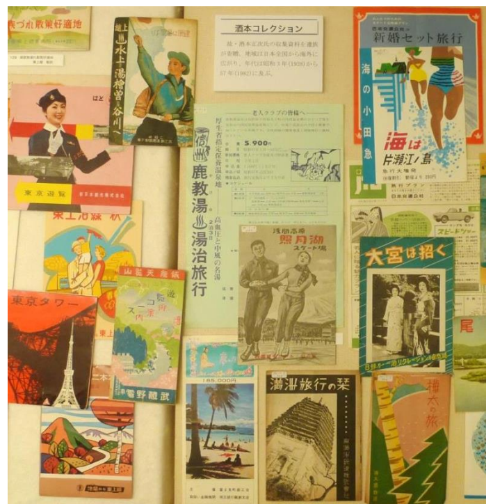
酒本コレクション