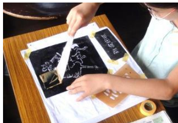
慎重に糊をのせます

最後は染めて仕上げ。手も青くしながら、きれいに染まるまで頑張りました。迎えに来た家族に、作った様子を説明しながら作品を見せ、満足そうでした。今回の体験を通じて、ものづくりの魅力を感じてもらえればと思います。(早川純彦)