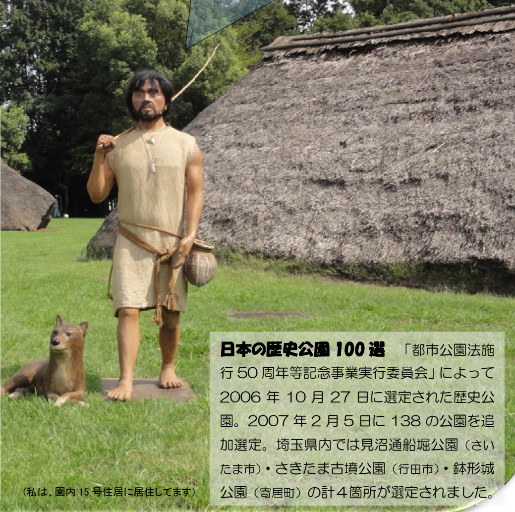
（私は、園内 15 号住居に居住しています）

貝塚の多い関東地方でも縄文時代前期の貝塚が史跡指定されたのは、水子貝塚が初めてです！