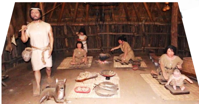
15号住居内の実物大の生活復原展示