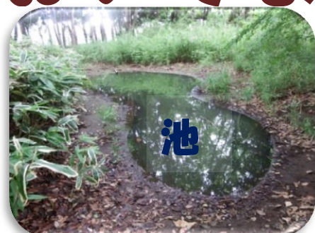
縄文の森の中に野鳥の貴重な水場があります。面積 17.18㎡。