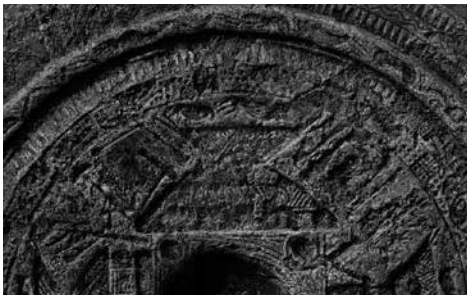
家屋文鏡(宮内庁書陵部)(展示品は複製品)