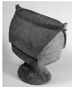
家形土器(厚木市教育委員会)