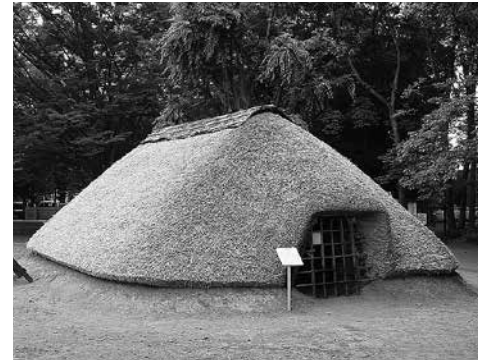
水子貝塚 第2号復元竪穴住居 (左・平成6年設計図、中・平成6年復元、右・平成27年復元)