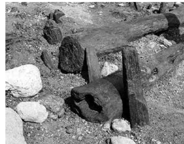
打ち込まれた杭 東京都下宅部遺跡(東村山市教育委員会)