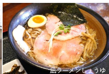
風ラーメンしょうゆ