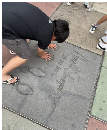
チャイニーズシアター