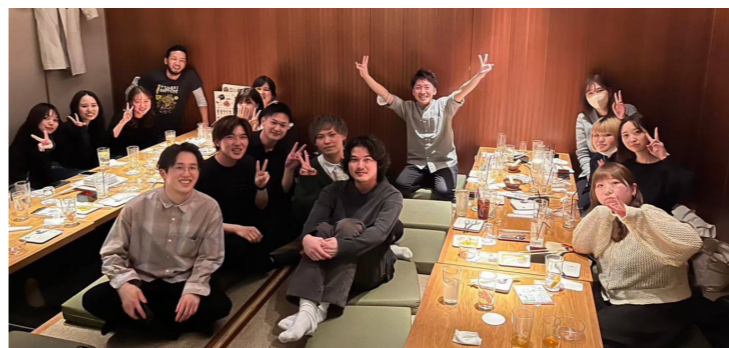
美容室のスタッフと

旅行好きのわが家は、昨年夏4年振りの海外旅行へ。アメリカのサンフランシスコ(SF)からロサンゼルス(LA)まで車の旅。SFではゴールデンゲートブリッジを船に乗って観光。ヨセミテでは大きな滝や子熊にも遭遇。気温50度を体感すべくデスバレーの砂漠へ。夜は大きな火球とたくさんの流れ星に感動。大自然に触れた。 LAでは息子が楽しみにしていた戦艦アイオワを見学。夢が叶って大満足な息子。サンタモニカのビーチで波乗りを楽しみ、チャイニーズシアターではシユワちゃんの手形に大喜び。旅の最後はエンゼルス大谷翔平の試合を観戦！充実した2週間を過ごした。今年の旅行も今から楽しみで仕方がない。 (Sさん 40代 羽沢)