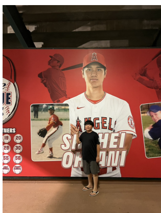
エンゼル・スタジアム