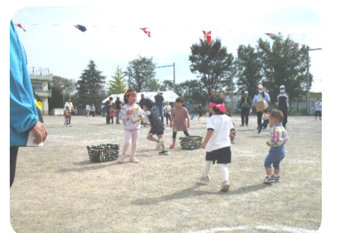
お菓子つかみ取り競争