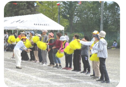
黄色いポンポンが目立っていた!