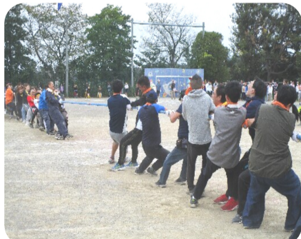
力が入った綱引き