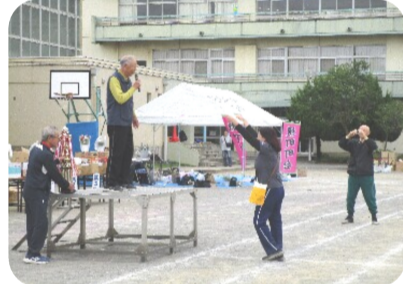
2丁目町会優勝おめでとう!