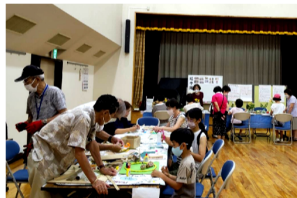
令和5年 体験教室の様子

下校時の見守りが年間を通しての活動ですが、例年夏休みには「体験教室」を開催してきました。コロナ禍での自粛のあと今年は念願の再開を!公民館で活動されている「オリベの会」さんに陶芸を、「絵てがみペンぱる」さんに絵てがみをご指導いただきました。