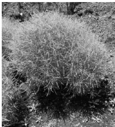
丸池集会所のコキア

種は畑のキャビアと言われ、ゆでて食べるとか。食べたことはないのですが、これが「とんぶり」だそうです。(西角)