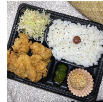
あたたかな手作り弁当