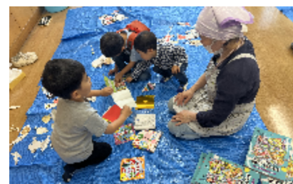
毎回子どもたちの遊びコーナーが設けられています

設立年月 令和3年3月から 開催場所 鶴瀬西交流センター（大字鶴馬3575-1） 開催日時 原則 毎月第4木曜日 弁当配布 午後4時30分～6時 食堂 午後5時30分～6時50分 開催形態 弁当（約150食）と食堂（約50食） 弁当1個 200円 食堂大人300円 小～中学生100円 幼児無料 大事にしていることは