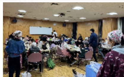
ひとりぐらしの高齢者の方が「みんなで話しながら食べる」と参加しています