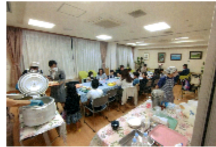
子どもだけやご家族で参加している方が楽しく食事をしています