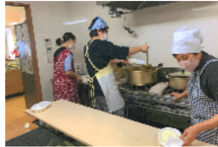
学生や地域のボランティアによる調理が行われています