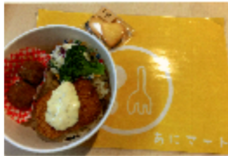
ロゴ入りランチョンマット

大事にしていることは 子どもたちが家や学校以外で、安心して過ごせるちょっとした場所となるように心がけ、職員や地域の方々とのかかわりを通して「自分は愛される大切な存在」と思ってもらえるよう支援しています。