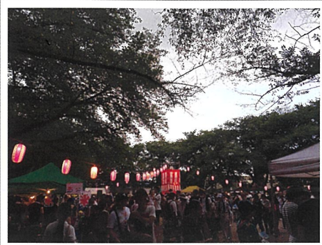
▲大にぎわいの東みずほ台まつり