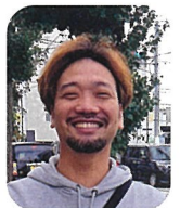
水村会計 こんがり亭