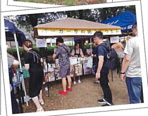
▲商店街のいつものお店が会場に

みずほ台中央公園で毎年開かれる東みずほ台祭りは2023年に28回を迎えています。町会や商店会、地域の団体が協力し実行委員会をつくり運営しています。盆踊りやみずほ子ども太鼓の演奏、抽選会、子どもたちが楽しめるコーナーや町会の模擬店など盛りだくさんのお祭りです。東みずほ台商店会の有志も会場です。