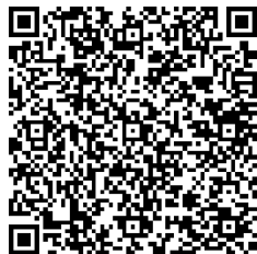
パパママ準備教室動画