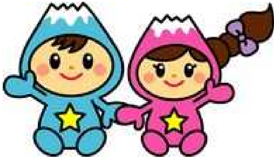
富士見市マスコットキャラクター 「ふわっぴー」