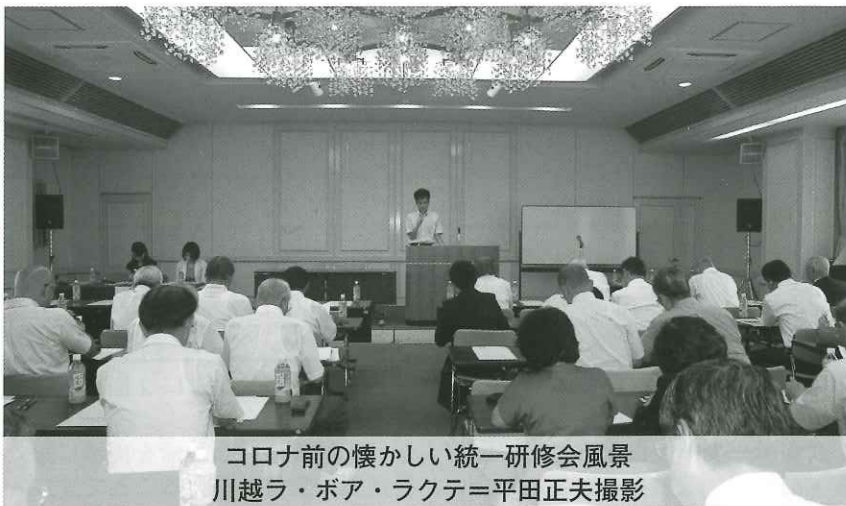
コロナ前の懐かしい統一研修会風景 川越ラ・ポア・ラクテ

結びに、川越地区保護司会の皆様方の益々のご健勝とご活躍をご祈念申し上げます。ご挨拶とさせていただきます。