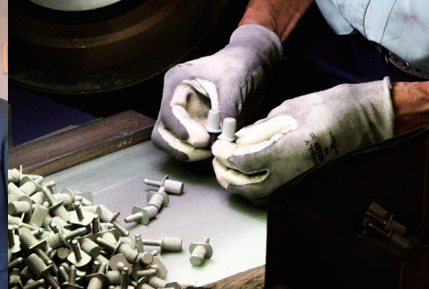
最終検査は熟練工による目視