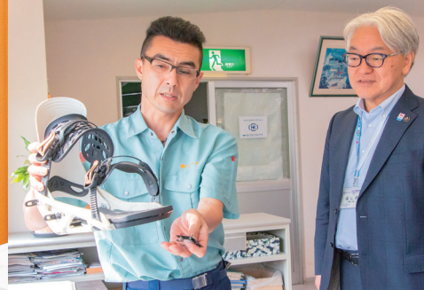
スノーボードとビンディングの締結に使用